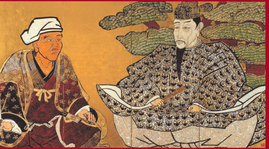
つらがまえ ほうたいこう くろだじゅすい 《面構 豊太閤と黒田如水》 1970(昭和45)年 神奈川県立近代美術館蔵