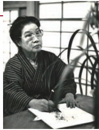
あいざわ めのる ©相澤 實

1905(明治38)年、札幌生まれ。女子美術学校を卒業後、神奈川県横浜市の大岡尋常高等小学校(現横浜市立大岡小学校)に勤めながら、創作を続けました。再興第17回院展に25歳で入選、のちに同人に推挙され日本画家としての地位を確立。1989(平成元)年、文化勲章を受章。また、1970(昭和45)年から2008(平成20)年に103歳で逝去するまで富士山をのぞむ藤沢市に住んでいました。