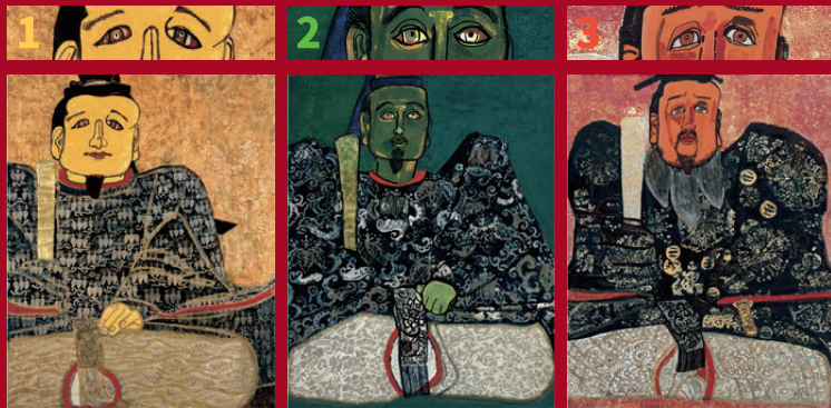
つらがまえ あしがたかうじ 《面構 足利尊氏》 1966(昭和41)年 神奈川県立近代美術館蔵