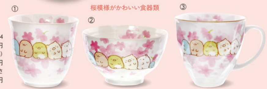
① 桜模様がかわいい食器類 ② ③

太宰府店限定 ◎太宰府 豆皿 [梅と麻の葉] (直径9.0×高さ1.5cm) .....880円