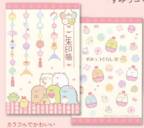
カラフルでかわいい御朱印帳

通常、東京では手に入らない全国5店舗のみで販売している「すみっこぐらし堂」のグッズを特別にご用意しました。