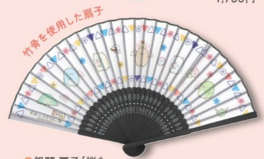
銀閣 扇子 [桜もよう] (親骨の長さ21cm) .....1,650円

伊勢店限定 ◎伊勢 御朱印帳 [つるし雛] (タテ18.2×ヨコ12.0cm) .....1,760円