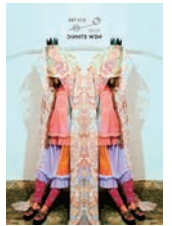
RBTXCO (アールビーティー)

CASHYAGEはカシミア専門 アパレルメーカーが発信する カシミアニットブランドで す。CASHYAGEとは CASHMERE(カシミア)と VOYAGE(旅)と言う言葉を ミックスした造語で、世界中 を旅して、街角の風景や様々 な人々たちとの出会いや文化 にインスピレーションを得た デザインは遊び心と心地よい 着心地を追求します。