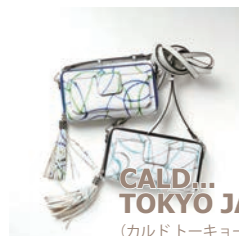
CALD... TOKYO JAPAN (カルトトーキョージャパン)