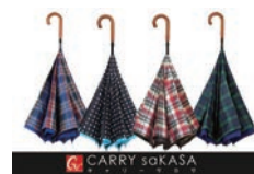
CARRY saKASA (キャリーサカサ)