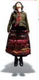
TISSU ROUGE (ティシュルージュ)