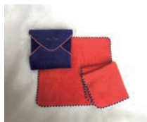
Mon Luxe (モンリュクス)