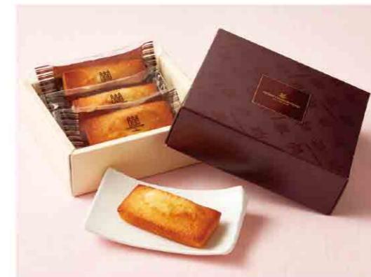
B052601 〈アンリ・シャルパンティエ〉 フィナンシェ3個入 税込 540 円(本体価格500円) 箱サイズ:約11.7×12.9×3.9cm 賞味期限:製造日から42日間 ※20箱から承ります。