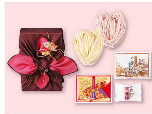
B052503 〈柳屋本店〉幸福うどん KU10 税込 1,080 円(本体価格1,000円) 花削り(3g)2袋、うどん(赤・白)各1個、だしぼく(6g×2包) 1袋、梅干し2個入/箱サイズ:約14.0×20.0×11.0cm 賞味期限:製造日から1年間