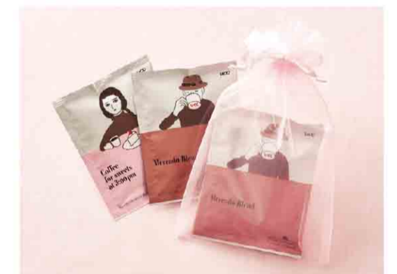
B052610 〈UCC〉 ドリップコーヒー 税込 573 円(本体価格530円) 2袋入/箱サイズ:約24.0×15.0×3.0cm/賞味期限:製造日 から1年間 ※数量変更は2週間前までをお願いいたします。