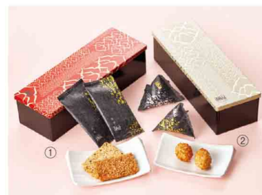
〈赤坂柿山〉 ① B052513 赤坂慶長 紅缶 慶長醤油・慶長胡麻 各7枚入 ② B052514 赤坂慶長 真珠缶 慶長醤油・慶長塩 各4粒入 各税込 1,080 円(各本体価格1,000円) 箱サイズ:約21.2×7.3×5.2cm 賞味期限:各製造日から180日間 ※紅白2本組も承ります。