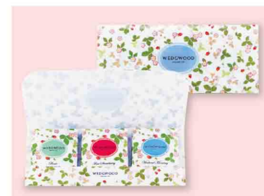
B052612 〈ウェッジウッド〉 ワイルド ストロベリー ティーバッグ 税込 540 円(本体価格500円)/ファイン ストロベリー・ ピクニック・ウィークエンド モーニング(2g)各3袋入 箱サイズ:約10.0×23.0×1.0cm/賞味期限:製造日から3年間