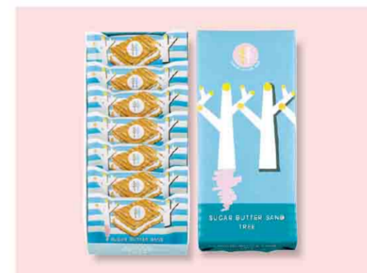
B052608 〈シュガーバターの木〉 シュガーバターサンドの木 税込 573 円(本体価格530円) 7個入/箱サイズ:約10.5×23.5×3.5cm 賞味期限:製造日から90日間