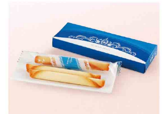
B052607 〈ヨックモック〉シガール 税込 270 円(本体価格250円) 3本入/箱サイズ:約17.5×6.5×2.0cm 賞味期限:製造日から60日間 ※受注生産のため、14日前まで にご予約ください。※ご予約後、数量変更はお受けできません。