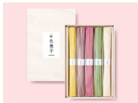
B052504 〈池利〉手延べ三輪素麺「色撫子」 税込 1,080 円(本体価格1,000円) かぼす・紫芋・梅・青しそ・白(50g)各1束入 箱サイズ:約20.3×13.7×3.6cm 賞味期限:製造日から1260日