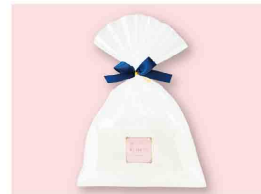
B052606 〈横濱元町霧笛楼〉 横濱煉瓦プライダルパッケージ 税込 324 円(本体価格300円) 1個入/箱サイズ:約15.0×11.5×4.0cm/賞味期限:製造日から 90日間 ※ご予約後、数量変更は2週間前までをお願いいたします。