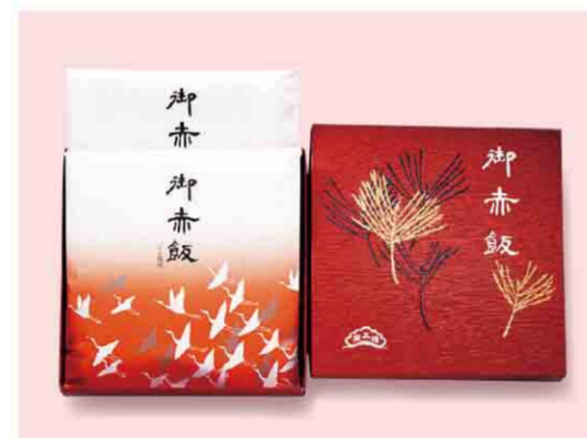
B052507 〈榮太樓總本舗〉御赤飯 税込 1,296 円(本体価格1,200円) 御赤飯(220g)2個入/箱サイズ:約17.5×17.5×3.9cm 賞味期限:製造日から1年間 ※お申し込みからお渡しまで20日間いただきます。