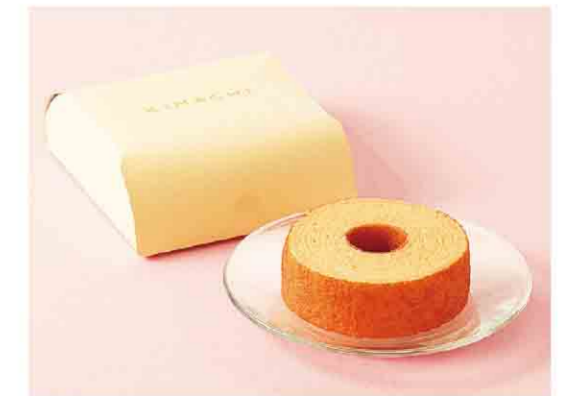
B052603 〈パティスリー キハチ〉 プティBOX パームクーヘン 税込 346 円(本体価格320円) 1個入/箱サイズ:約9.0×10.0×3.5cm 賞味期限:製造日から30日間