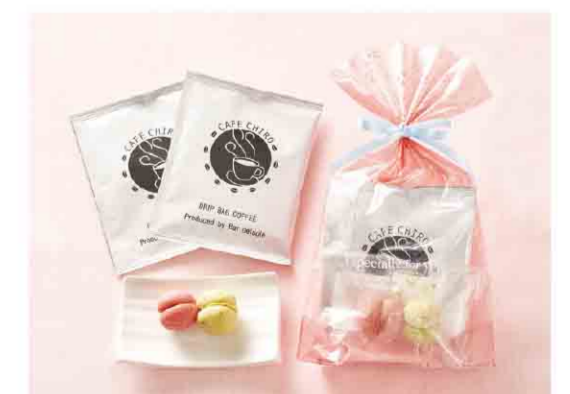
B052613 〈カフェテリア・デルソーレ〉 ドリップコーヒープライダルセット 税込 540 円(本体価格500円)/ドリップコーヒー2袋、クッ キー2個入/箱サイズ:約21.0×15.0×4.0cm/賞味期限: ドリップコーヒー製造日から1年間、クッキー製造日から20日間