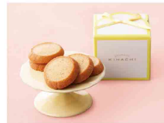
〈パティスリー キハチ〉 ① B052604 プティBOX バニラクッキー ② B052605 プティBOX 黒胡麻と黒糖クッキー 各税込 540 円(各本体価格500円) 箱サイズ:約70×70×6.0cm/賞味期限:各製造日から30日間 ※写真は①です。