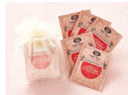
B052609 〈H&F BELX〉 ルイボスティ 税込 481 円(本体価格445円) ティーバッグ5袋入/箱サイズ:約14.0×14.0×1.5cm