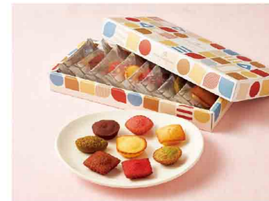
B052602 〈アンリ・シャルパンティエ〉 プティ・ガトー・アソルティ 8個入 税込 702 円(本体価格650円) 箱サイズ:約10.4×23.4×2.9cm 賞味期限:製造日から60日間