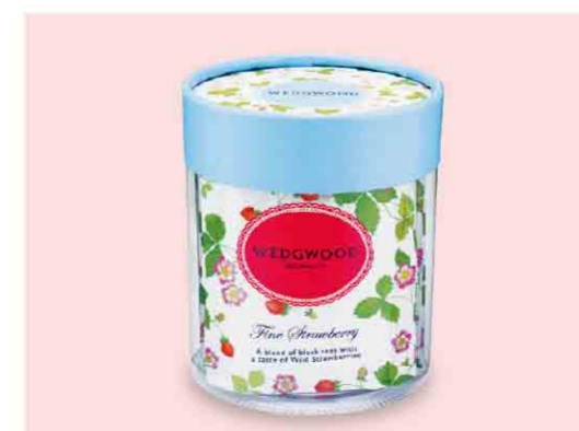
B052611 〈ウェッジウッド〉ワイルド ストロベリーアソート ティーバッグ(筒形)税込 540 円(本体価格500円) ファイン ストロベリー・アールグレイ フラワーズ・ピクニック (2g)各2袋、ウィークエンド モーニング(2g)3袋入 箱サイズ:約直径8.0×9.0cm/賞味期限:製造日から3年間