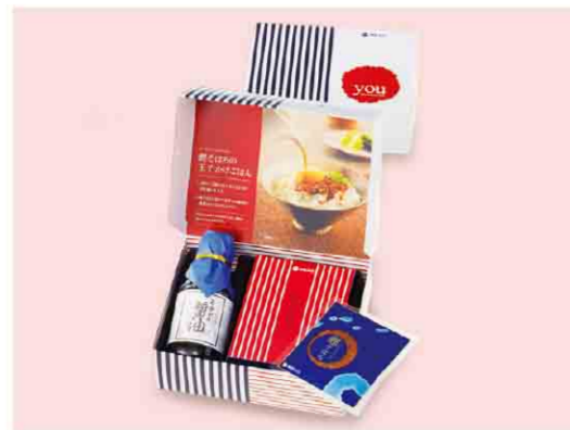
B052502 〈柳屋本店〉 玉子かけ醤油と麩そぼろ TKM10 税込 1,080 円(本体価格1,000円) 玉子かけ醤油(145ml)1本、麩そぼろ(7g)5袋入/箱サイズ: 約15.0×18.5×6.0cm/賞味期限:製造日から480日間