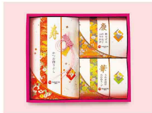
B052501 〈柳屋本店〉花結び KH10N 税込 1,080 円(本体価格1,000円) 花削り(3g)8袋、梅茶漬(4.3g)3袋、わかめスープ(5.3g)・ 麩そぼろ(7g)・のり玉子ふりかけ(4.5g)各2袋入 箱サイズ:約23.5×28.0×6.5cm/賞味期限:製造日から1年間