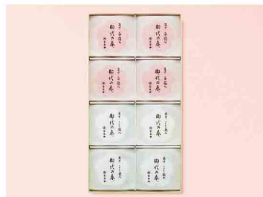
B052509 〈とらや〉 最中8個入(紅白) 税込 2,214 円(本体価格2,050円) 8個入/箱サイズ:約29.4×15.6×3.1cm 賞味期限:製造日から24日間