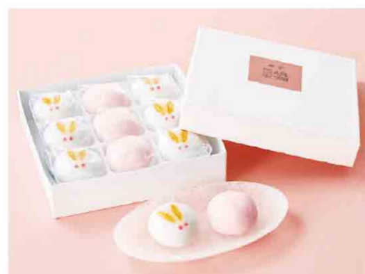
B052512 〈塩瀬総本家〉 祝いうさぎ 税込 1,404 円(本体価格1,300円) 9個入/箱サイズ:約15.8×15.8×3.7cm 賞味期限:製造日から10日間