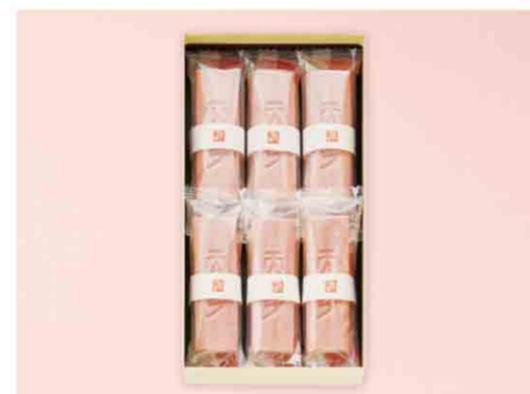
B052510 〈たねや〉 招福ふくみ天平 税込 1,275 円(本体価格1,180円) 6個入/箱サイズ:約23.0×13.0×4.1cm 賞味期限:製造日から45日間