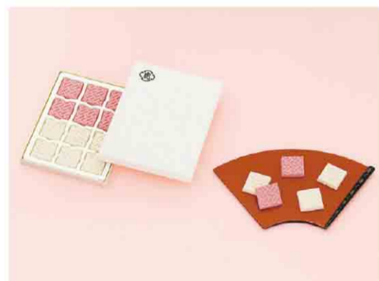
B052508 〈とらや〉推古12個入 税込 1,296 円(本体価格1,200円) 12個入/箱サイズ:約15.4×12.0×1.5cm 賞味期限:製造日から180日間 ※10箱以上のご注文は事前にお問い合わせください。