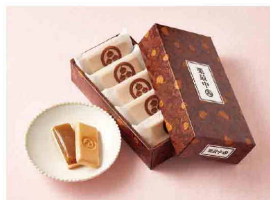
B052511 〈小布施堂〉 栗最中 税込 1,793 円(本体価格1,660円) 5個入/箱サイズ:約22.0×10.7×5.0cm 賞味期限:製造日から90日間